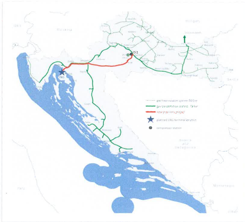
Figure 2 The existing transmission system of Plinacro, location of the LNG terminal, CS1 and Omišalj-Zlobin-Bosiljevo-Sisak-Kozarac gas pipeline