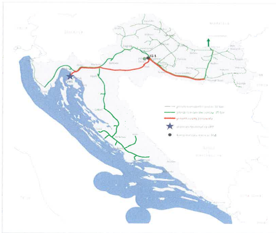
3 A Plinacro meglévő földgázszállító rendszere, a cseppfolyósított földgázterminál elhelyezkedése, CS1 és az Omišalj-Zlobin-Bosiljevo-Sisak-Kozarac-Slobodnica földgázvezeték

A földgázszállító csővezetékek kivitelezésének a harmadik szakasza a Kozarac-Slobodnica földgázvezeték megépítésére is kiterjed. Így a cseppfolyósított földgázterminál és a meglévő Slobodnica-Donji Miholjac-Dravaszerdahely határkereszteső földgázvezeték (3. ábra) között közvetlen kapcsolatot hozna létre az új szállítóvezetékek rendszere. A Kozarac-Slobodnica földgázvezeték 128 km hosszú nyomvonalát a meglévő földgázvezetékek folyosójában tervezték, a földgázvezetékek névleges átmérője 800 mm, míg a maximális üzemi nyomás 75 bar lenne. Ennek a földgázszállító csővezetékrendszernek a tervezett tökeberuházási értéke (összesen) 100 millió euró (750 milliárd kuna), ami azt jelenti, hogy a szükséges beruházások teljes költsége 317,15 millió euró (1. forgatókönyv + 2. forgatókönyv + 3. forgatókönyv – 35 + 182.15 + 100 = 317,15).