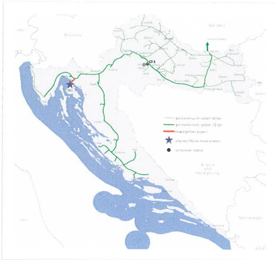
1 A Plinacro meglévő földgázszállító rendszere, a cseppfolyósított földgázterminál elhelyezkedése, az Omišalj-Zlobin földgázvezeték és a CS1