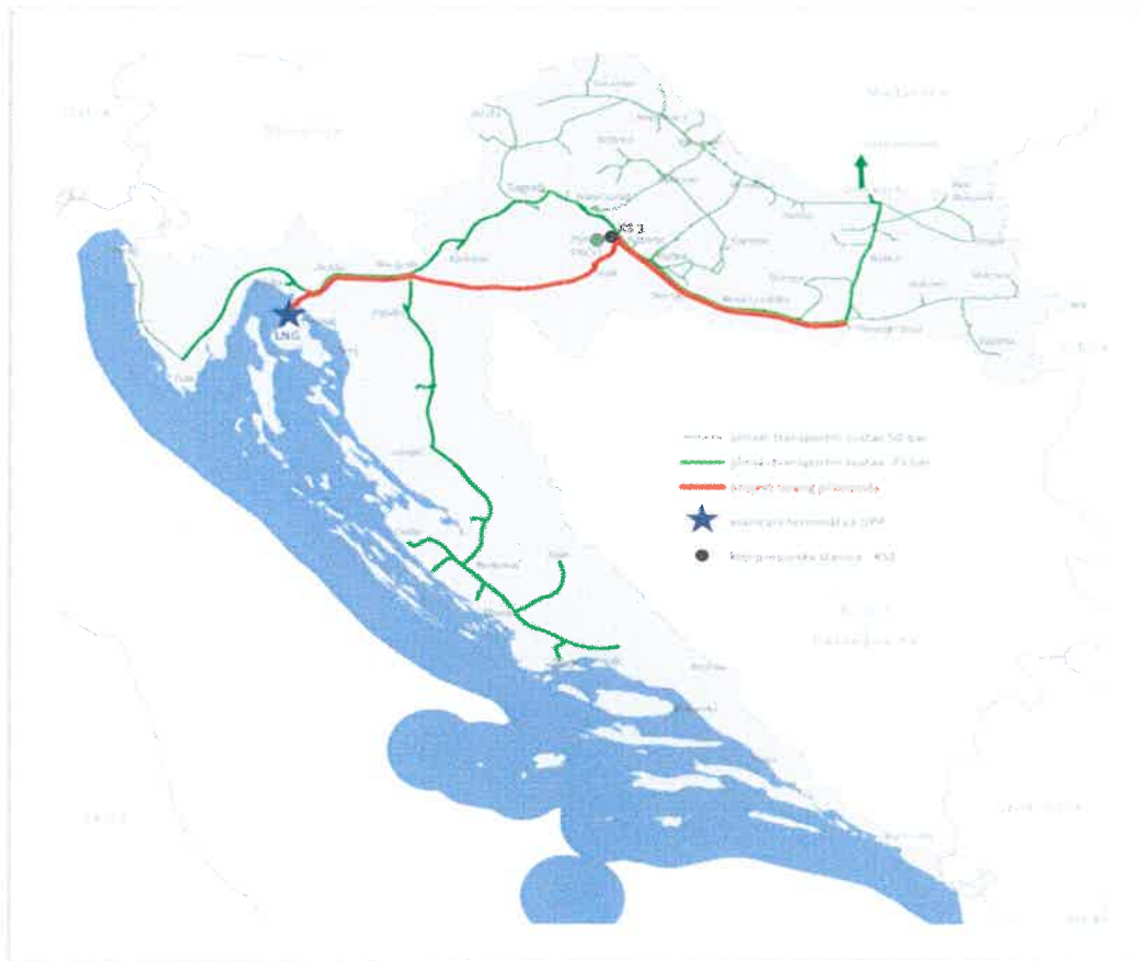
Figure 3 The existing transmission system of Plinacro, location of the LNG terminal, CS 1 and Omišalj-Zlobin-Bosiljevo-Sisak-Kozarac-Slobodnica gas pipeline

The third phase of the construction of delivery gas pipelines includes the construction of Kozarac-Slobodnica gas pipeline. In this way, the LNG terminal and the existing Slobodnica-Donji Miholjac-Drávaszerdahely interconnection gas pipeline (Figure 3) would be directly connected by the system of new delivery pipelines. The route of Kozarac-Slobodnica gas pipeline, 128 km long, has been planned in the corridor of the existing gas pipelines, a nominal diameter of the gas pipeline would be 800 mm, and the maximum operating pressure of gas 75 bar. The planned CAPEX of this gas pipeline is EUR 100 (total) million (HRK 750 million) which means that the total cost of the necessary investments equals EUR 317,15 million (SC1 + SC2 + SC3 – 35 + 182,15 + 100 = 317,15).