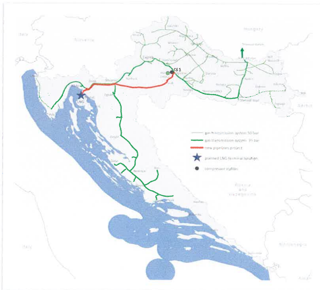
2 A Plinacro meglévő földgázszállító rendszere, a cseppfolyósított földgázterminál elhelyezkedése, CS1 és az Omišalj-Zlobin-Bosiljevo-Sisak-Kozarac földgázvezeték

A Zlobin-Bosiljevo-Sisak-Kozarac földgázszállító rendszer fejlesztéséhez a területfoglalási engedélyeket már megszerezték. A további tevékenységek a fő tervek kidolgozását és az építési engedélyek megszerzését célozzák meg. A Zlobin-Bosiljevo-Sisak-Kozarac földgázszállító vezetékrendszer a tervek szerint 2020-ben valósul meg, üzleti üzembe helyezésére pedig várhatóan 2020–2021-es gázévben kerül sor.