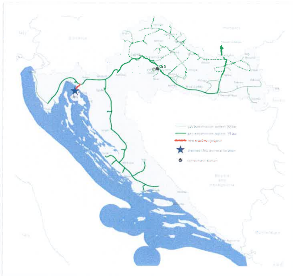
Figure 1 The existing transmission system of Plinacro, location of the LNG terminal, Omišalj-Zlobin gas pipeline and CS1

The key facility that Plinacro needs to construct in order to provide the gas transmission via the existing transmission system is Omišalj-Zlobin gas pipeline. This gas pipeline will connect the LNG terminal on the island of Krk and the existing transmission system PN75 near Zlobin municipality (Figure 1). The anticipated Omišalj-Zlobin gas pipeline will be of nominal diameter 1000 mm (40"), maximal operating pressure 100 bar and it will be 18 km long. The planned CAPEX for Omišalj-Zlobin gas pipeline is EUR 35 million (HRK 265 million). Omišalj-Zlobin gas pipeline is in the phase of a building permit obtaining. The completion of the gas pipeline construction has been planned in 2019, and its commercial commissioning has been planned in the gas year 2019/2020.