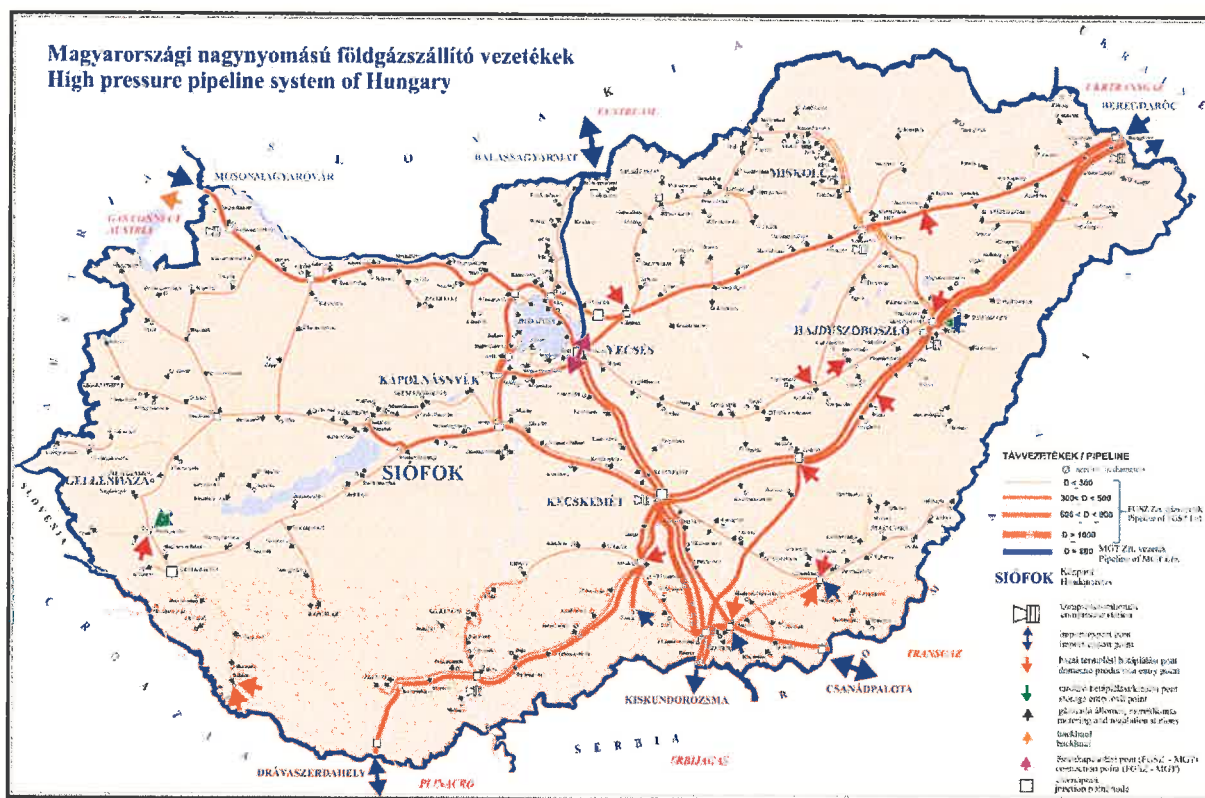
4. ábra: A magyarországi szállítórendszer

Az FGSZ szállítórendszere (4. ábra) teljes mértékben alkalmas az LNG-terminálból Drávaszerdahely határkeresztező pontra érkező földgáz teljes mennyiségének továbbszállítására. A jelen Open Season eljárásban az FGSZ oldaláról nincs szükség kapacitásbővítéshez kapcsolódó tőkebefektetésre, a 3.3 pontban leírt forgatókönyvek bármelyikének megvalósulása esetén sem. Az FGSZ szerepe az eljárásban kizárólag a szabad, nem megszakítható, kapcsolt kapacitások allokációjára korlátozódik Drávaszerdahely határkeresztező ponton Horvátország-Magyarország irányában.