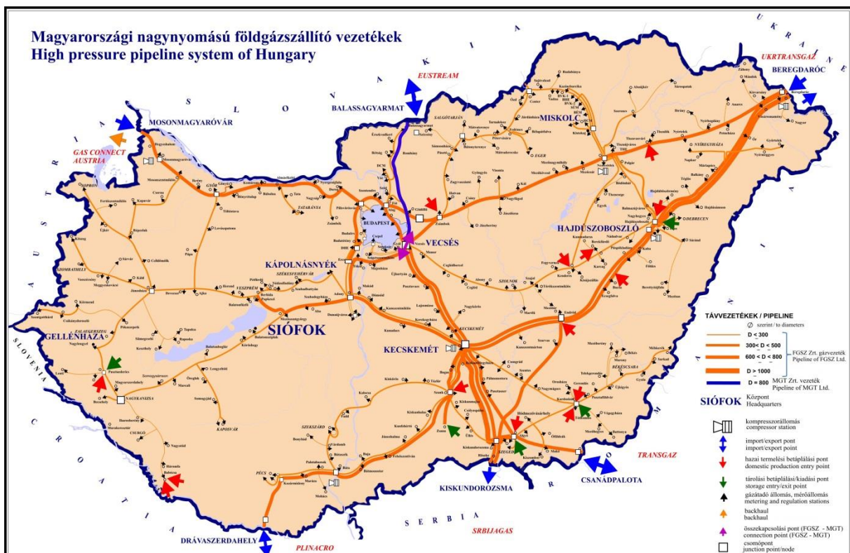
3. ábra: A magyarországi szállítórendszer

Az FGSZ szállítórendszere (4. ábra) teljes mértékben alkalmas az LNG-terminálból Drávaszerdahely határkeresztesző pontra érkező földgáz teljes mennyiségének továbbszállítására. A jelen Open Season eljárásban az FGSZ oldaláról nincs szükség kapacitásbővítéshez kapcsolódó tőkebefektetésre, a 3.3 pontban leírt forgatókönyvek bármelyikének megvalósulása esetén sem. Az FGSZ szerepe az eljárásban kizárólag a szabad, nem megszakítható, kapcsolt kapacitások allokációjára korlátozódik Drávaszerdahely határkeresztesző ponton Horvátország-Magyarország irányában.