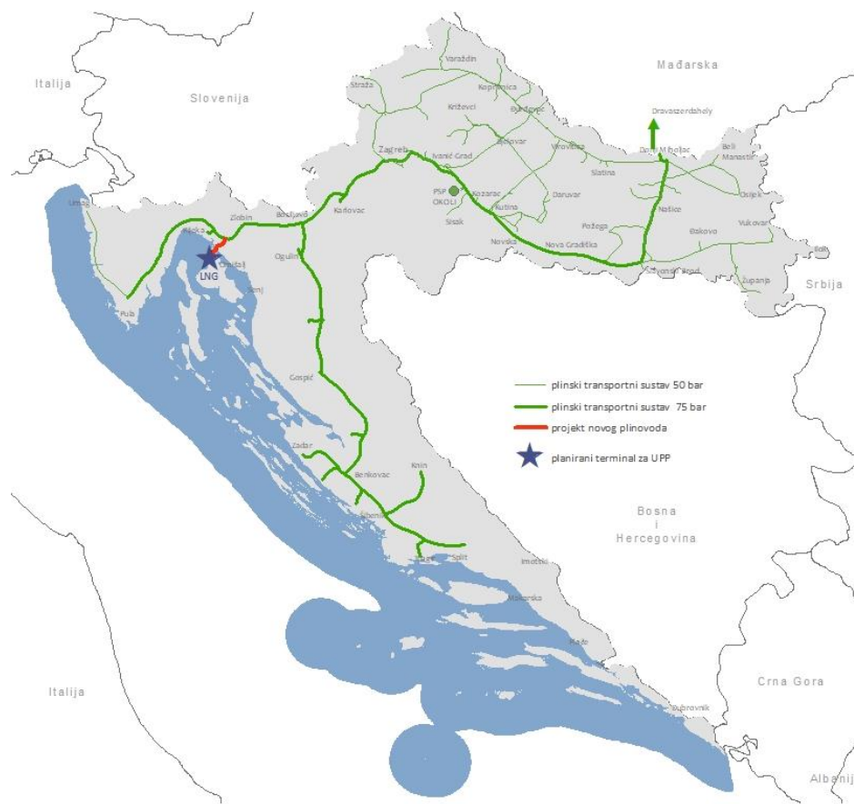
1 A Plinacro meglévő földgázszállító rendszere, a cseppfolyósított földgázterminál elhelyezkedése és az Omišalj-Zlobin földgázvezeték.

Az LNG termináltól a meglévő földgázszállító rendszerhez való csatlakozást biztosítja az Omišalj–Zlobin gázvezeték (1. ábra). A tervezett Omišalj-Zlobin földgázszállító csővezeték névleges átmérője 1000 mm (40"), maximális üzemi nyomása 100 bar, hosszúsága pedig 18 km. Az Omišalj-Zlobin földgázvezetékre tervezett tőkeberuházás (CAPEX) összege 35 millió euró (265 millió kuna). Az Európai Bizottság az első fázis kivitelezési munkáira 2018.01.25-én a támogatható költségek 50%-át (16.433.500 euró) ( https://ec.europa.eu/inea/en/connecting-europe-facility/cef-energy/construction-works-lng-evacuation-gas-pipeline-section-omi%C5%A1alj ). Omišalj-Zlobin földgázszállító csővezeték az építési engedélyeztetési szakaszban van. A földgázvezeték kivitelezése a tervek szerint 2019-ben készül el, annak üzleti célú üzembe helyezésére a 2019–2020-as gázévben kerülhet sor, az LNG terminál infrastruktúrájának megépítése és átadása függvényében.